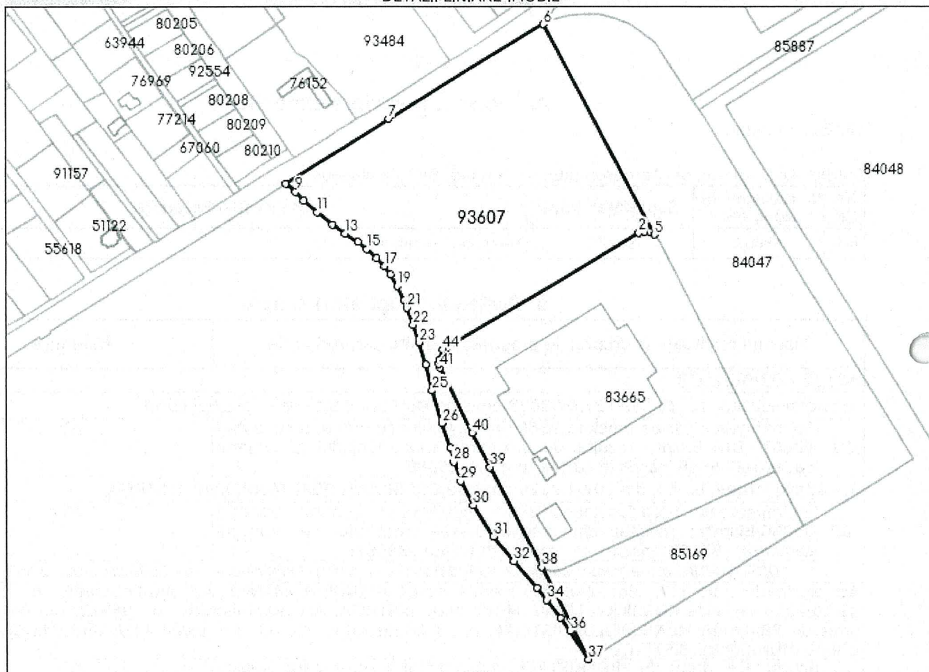
DETALII LINIARE IMOBIL

* Suprafața este determinată în planul de proiecție Stereo 70.